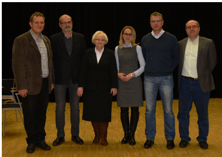
Zarząd RJP nr10

Jednocześnie pragniemy podziękować wszystkim Mieszkańcom Dębu za udzielone wsparcie w trakcie wyłaniania kandydatów oraz udział w wyborach.