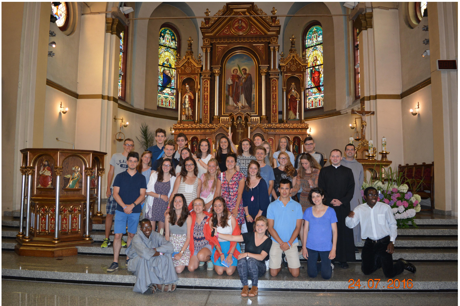
Młodzież z Paryża goszcząca w naszej parafii w związku z ŚDM w Krakowie 2016