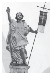
Figura zmartwychwstałego Chrystusa z chorągwią w ręce - przypomina zwycięstwo odniesione nad wrogami i chwałę otrzymaną przez Niego od Ojca Niebieskiego. Obok figury na ołtarzu stawia się krzyż z czerwoną stułą – symbol Chrystusa Kapłana.

wprost wskazuje na Chrystusa i mówi o Nim: "Oto Baranek Boży, który gładzi grzech świata" (J 1, 29). Także św. Jan Apostoł w Apokalipsie w wielu miejscach pisze o Chrystusie Baranku.