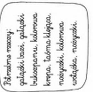
Palmie moacy: galacki bawie, galacki bukocapamu, kolorowa krepna, taoma klopca, moacycki, kolorowa wstążka, moacycki.