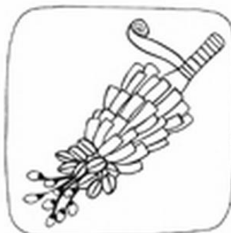
Na koniec dół palmowy owinię kolorową wstążką i zawinię kakamilkę. Gotowe!