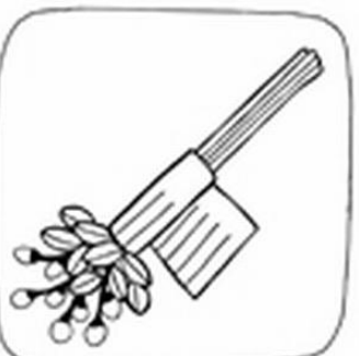
Owin krepną bukiet. Przyglowienie do galacki taoma klopca.