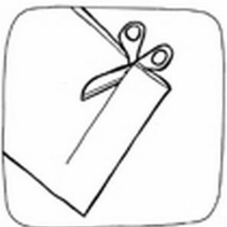
Paciki krepiny (osier. 17cm) pateraj w ten opaco.