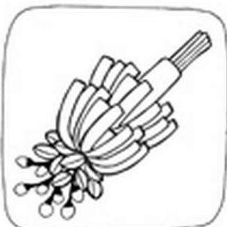
W ten opaco dwoje kilkol kolorowych waroów.