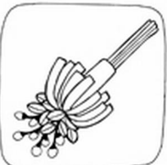
Wywin paciki krepiny do doku.