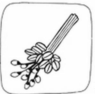
Złbie w bukiet bawie i bukocapam.