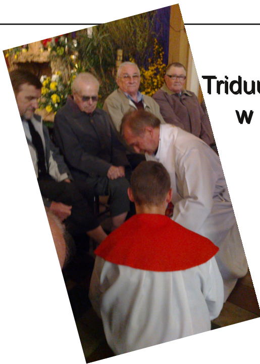
Triduum paschalne w obiektywie: